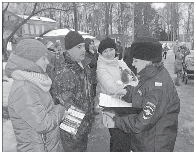
Напоминаем об ответственности за управление транспортом в пьяном виде.

В ходе их проведения водителям напомнили об административной ответственности за вождение в пьяном виде, а также проводился опрос общественного мнения по темам, касающимся ответственности за управление транспортными средствами в состоянии опьянения, причин данных противоправных действий, готовности населения сотрудничать с Госавтоинспекцией в их пресечении и предотвращении. С детьми была проведена беседа в виде викторины о необходимости повседневного использования в темное время суток световозражающих элементов. Всем участникам акций раздавались листовки с информацией о световозражающих элементах и светоотражающие приспособления (наклейки, браслеты), листовки на тему «Вино=Вина».