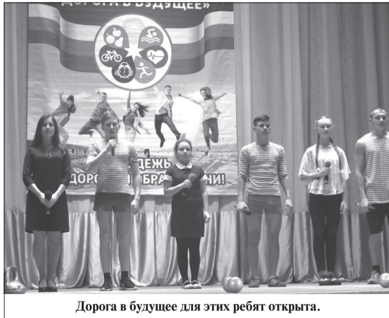
Дорога в будущее для этих ребят открыта.

Проведение профилактических мероприятий дает положительные результаты. Особенно хочется отметить значимый, имеющий богатый опыт, ежегодно проводимый в районе и отмеченный на заседании об-