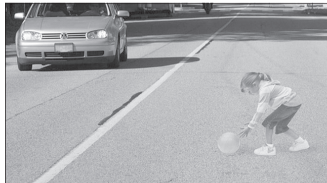
Эту малышку не научили безопасному поведению на дороге.

Для привлечения внимания родителей к правилам перевозки детей в стране сейчас идет активная агитационная кампания на дорогах. Плакаты «Куда посадить ребенка: в детское кресло или в инвалидную коляску» очень наглядные и обращают на себя внимание родителей, уверены эксперты. В некоторых регионах сотрудники полиции дарят автокресла тем родителям, которых поймали при перевозке младенца на руках в день выписки из роддома и рассказывают, почему опасно перевозить ребенка на руках и чем это чревато. Эти и другие акции, которые реализуют госорганы, возымели своей действие. По сравнению с прошлым годом количество ДТП с участием детей снижается, хотя и недостаточно быстро - на 0,1 % в год. Стоит сказать, что в общей структуре травматизма на автомобильные травмы приходится всего 1,2%, однако при этом они имеют высокую летальность и зачастую приводят к инвалидности. Правила перевозки детей на велосипедах также предполагают установку специальных удерживающих устройств и обязательное использование шлемов. Доказано, что использование мотоциклетных шлемов уменьшает риск гибели в ДТП на 40%, а тяжелых травм - примерно на 70%.