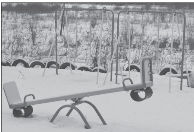
Малыши в детском саду, на площадке - пусто. Но это ненадолго.

Микрорайон Южный - большой, в настоящее время он разрастается, так как здесь выделяют квартиры в рамках программы переселения из ветхого жилья. Детей много, взрослые благоустроивали территории своими силами, но игровые лицензированные элементы были необходимы. Родители обратились к депутату района Елене Прокофьевой, которая пообещала, что по наказам избирателей в 2017 году площадка будет установлена. Денежные средства в сумме 100 тысяч рублей будут направлены из районного фонда депутатов. Жители высказывают слова благодарности за положительное решение вопроса.