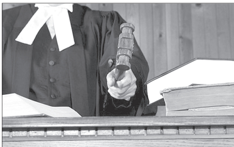
При обращении в суд следует указать, в чем состоит нарушение прав.

Если вы стали свидетелем грубых нарушений Правил дорожного движения, в том числе управления автомобилем в состоянии алкогольного опьянения, сообщите об этом ближайшему наряду ДПС или в дежурную часть ОМВД по телефонам: 8(49339)4-15-02 или 02.