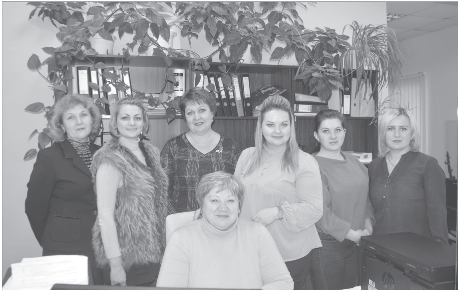
Дружный коллектив Приволжского МФЦ.

Конкурс проходил в двух номинациях: лучший МФЦ и лучший универсальный специалист МФЦ. В категории МФЦ с количеством не менее пяти окон обслуживания 1 место занял МФЦ Приволжского муниципального района, 2 место — МФЦ Южского, 3 — МФЦ Пестяковского района. В категории многофункциональный центр с количеством более пяти окон обслуживания победителями стали МФЦ городов Иваново и Кинешма, а также Фурмановского района, заняв первое, второе и третье места соответственно.